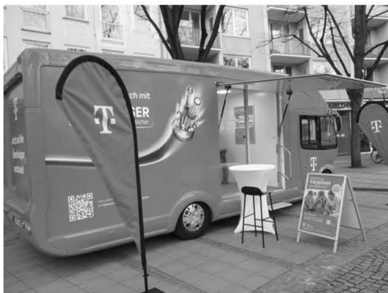
Deutsche Telekom auf Anwerbetour auf dem Weißenburger Platz