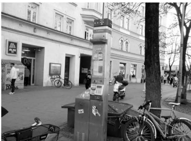
Orleansplatz: Anstatt alten Telefonschrott abzuräumen, stopft Telekom Deutschland die Gehsteige in unserem Viertel mit ca. 50 weiteren Schaltkästen für ein eigenes Glasfasernetz voll.

In der Folge haben wir eine Open Access Vereinbarung mit der Deutschen Telekom abgeschlossen, die dieser den aktiven Zugang zu unserem Netz ermöglicht. Die Kooperation wurde im vergangenen Jahr technisch umgesetzt, die ersten Telekom Kunden surfen bereits seit September vergangenen Jahres über unser Netz. Wir haben unsere Zusage aus dem Jahr 2021 also eingehalten. ... Ein Parallel-Ausbau in der Münchner Innenstadt, während viele Münchner Stadtteile und auch viele Städte und Gemeinden im Einzugsgebiet seit Jahren auf einen Glasfaseranschluss warten, ist absolut unsinnig. Hier wer-