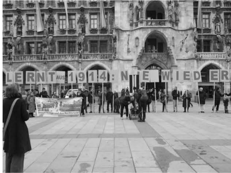
Marienplatz, 16. März 2025: Auf gewerkschaftlichen Aufruf protestierten etwa 150 Menschen gegen „Kriegskredite“ durch unbegrenzte Lockerung der „Schuldenbremse“ für Militärausgaben.

www.peaksid.com/de/investments/commercial , aufgerufen am 22.03.2025