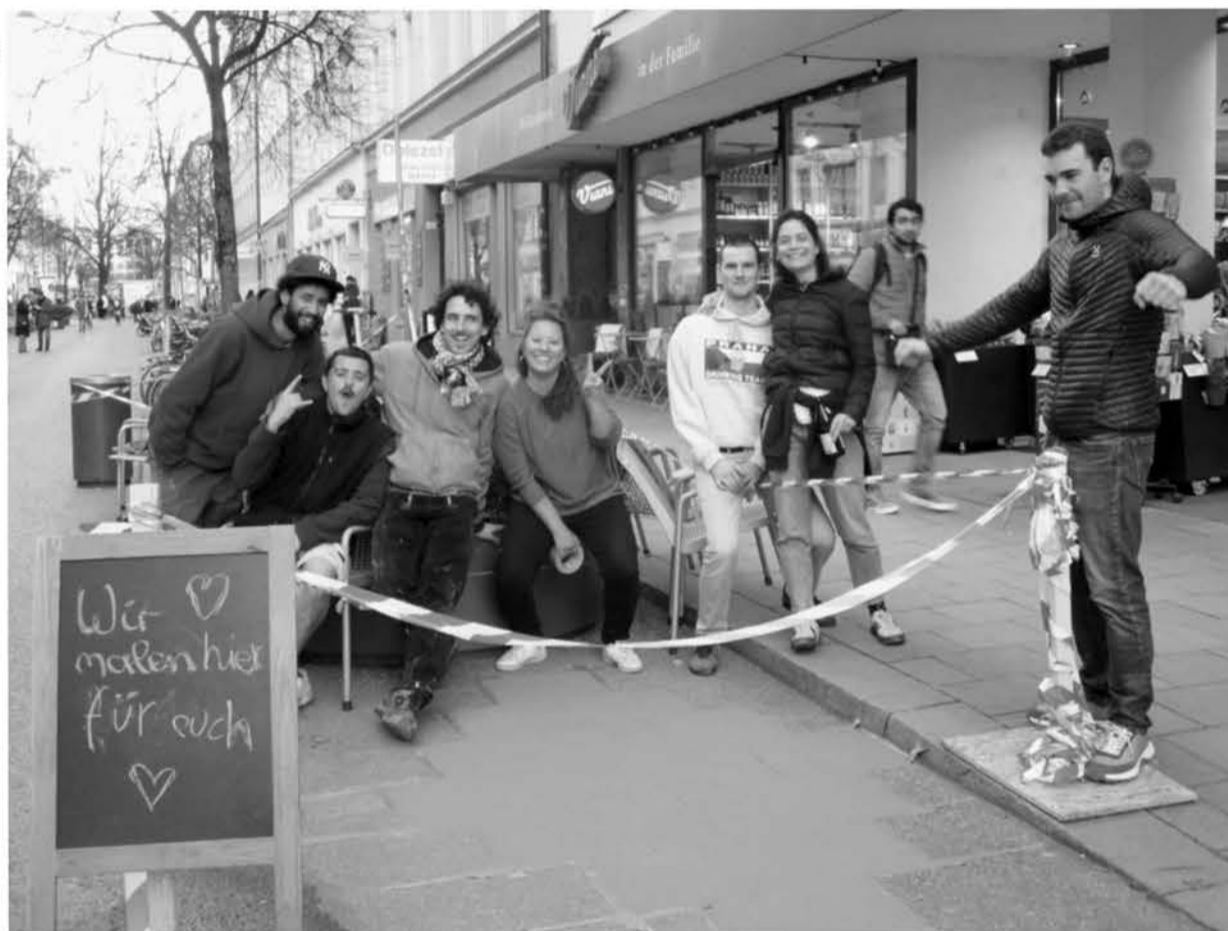
Kunst? Pfusch? Geldverschwendung? Da gehen die Meinungen auseinander. Die Städtischen jedenfalls freuen sich über ihre Mal-Aktion.

Die Malaktion zeitigte nicht den gewünschten Erfolg. Die angeblich „abriebfesten“ bunten Farbquadrate verwandelten sich kurz nach ihrem