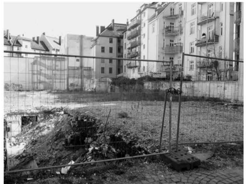
Franziskanerstraße 15/Rablstraße 43: Die Firma „Euroboden“ hat am 11. August 2023 Insolvenz angemeldet. Seitdem liegt der Baugrund brach. Dem Vernehmen nach hat auch das Kommunalreferat für die Stadt München ein Kaufgesuch abgegeben. Der Insolvenzverwalter „Müller-Heydenreich, Bierbach & Kollegen“ berücksichtigte es nicht und sucht weiter solvente Käufer.