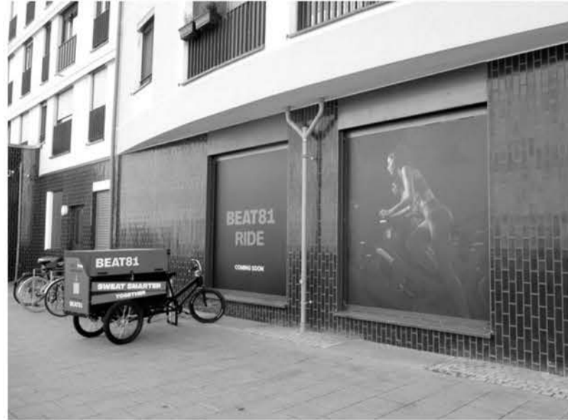
Welfenstraße 18: Statt einem Lieferdienst zieht dort demnächst ein Fitness-Studio ein.