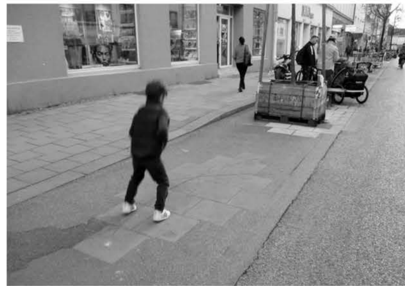
Ein Kind hat die Farbquadrate als Hüpfkästchen entdeckt.

Fundament gegenseitigen Vertrauens an der Schnittstelle von Verwaltung und Politik auf der einen und den für das Stadtviertel tätigen Aktiven auf der anderen Seite, die in unserem Stadtviertel für Freude am Stadtviertelleben, künstlerischen Genuss und gesellschaftli-