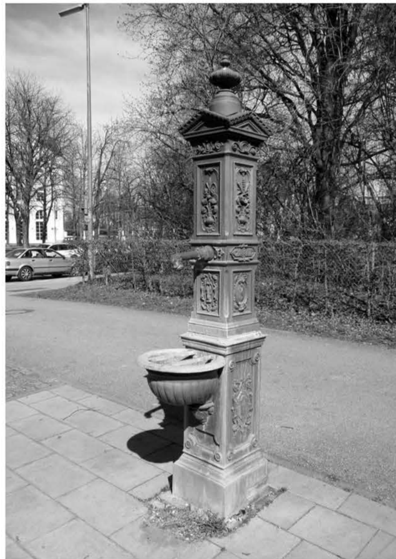
Suchbild: Sehr beliebt, sobald die Temperaturen steigen - wo steht dieser Trinkwasserbrunnen? Auflösung des letzten Suchbilds: Die Augen nach oben muss richten, wer das aus Ziegeln gemauerte Gewölbe im Durchgang von der Inneren Wiener in die Eggenstraße/Preysingplatz betrachten möchte.