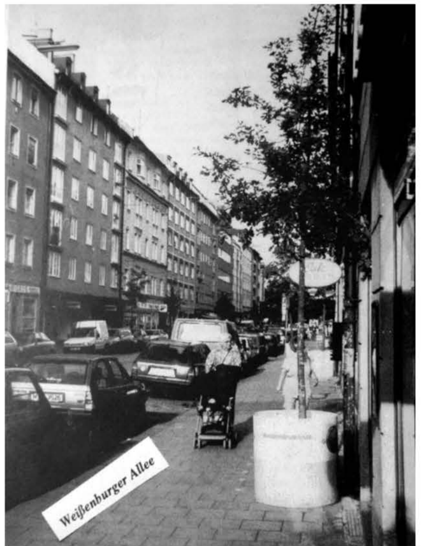
„Wanderbäume“ in der Weißenburger Straße (Ausgabe 8/1996)

„Presseinformation des ADFC – Fahrrad-Club befürwortet Verbesserungen für Fußgänger“: Die Radler-Lobby zeigte Weitblick und unterstützte städtische Bemühungen, Verbesserungen für Radler nicht allein zu Lasten von Fußgän-