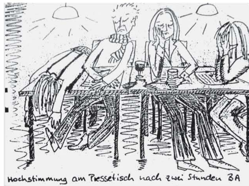
BA-Berichterstattung (Ausgabe 2/1999)

„Kellerstraße: Sanierung gescheitert – ‚Schärfl‘ nimmt sein Scherfl mit“: „Die Metallbaufirma ‚Schärfl‘ gibt ihren Sitz an der ... Kellerstraße auf. Besiegelt ist damit der Verlust von 15 Arbeitsplätzen. ... Unbemerkt von der Öffentlichkeit schwelte ... ein zäher Streit zwischen der Metallbaufirma und der städtischen Verwaltung. Vergeblich klagte der Betrieb gegen die neue Tram. Bei der Suche nach geeigneten Zufahrtswegen stieß ‚Schärfl‘ beim Planungsreferat auf fehlendes Entgegenkommen.“