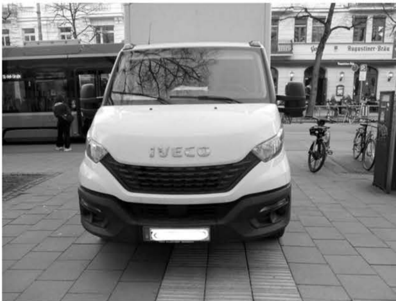
Tramhaltestelle Wörthstraße: Zugeparkte taktile Bodenmarkierung führt Menschen mit Sehbehinderung ins blecherne Hindernis und nicht in die Tram. Laut „Münchner Verkehrsgesellschaft (MVG)“ meldet das Fahrpersonal solche Behinderungen an die Zentrale.