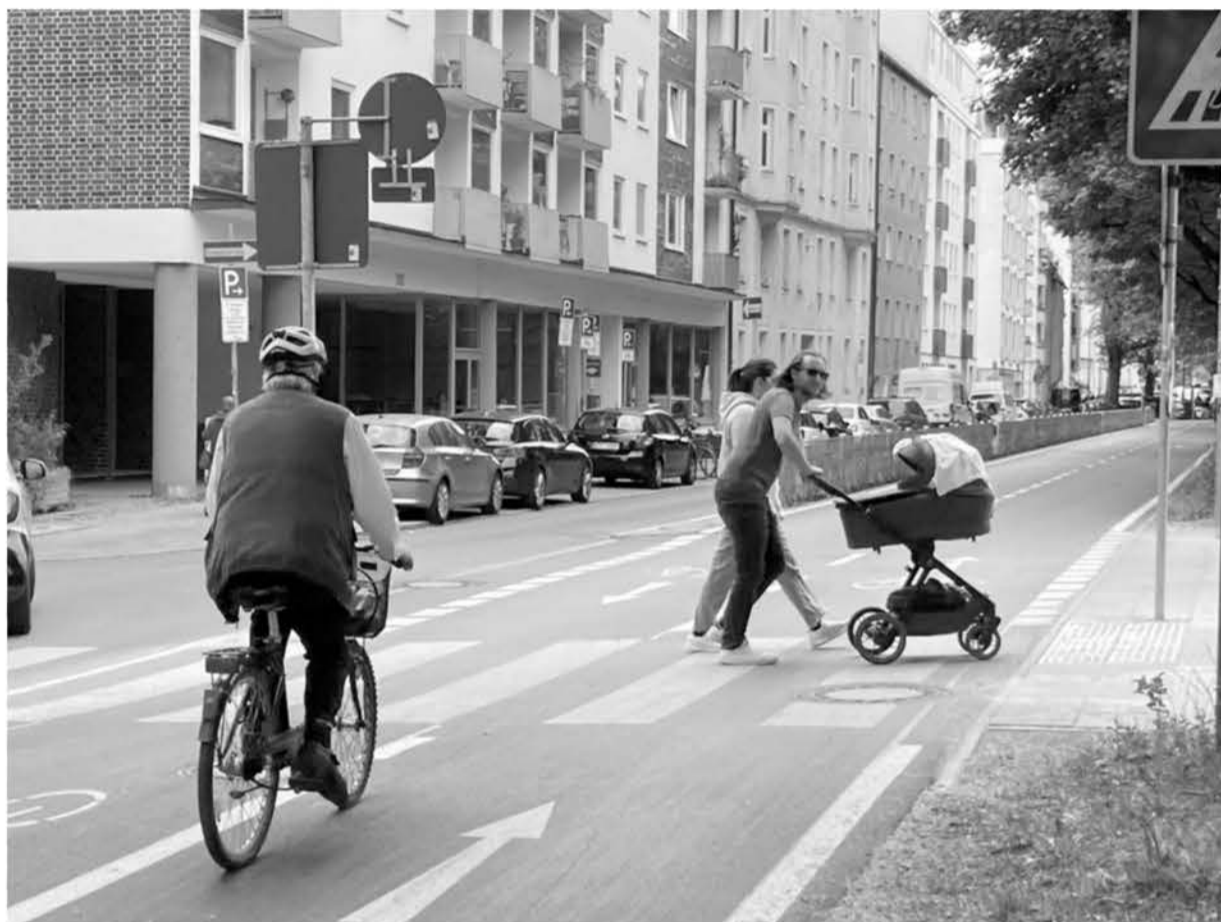
Zebrastreifen über den neuen Zweirichtungs-Radweg entlang der Zeppelinstraße. Ob die Radler*Innen und E-Scooter*Innen wohl die Bedeutung eines Zebrastreifen verinnerlicht haben? Bei einer kurzen Beobachtung stand es 1:1. Der erste Radfahrer (Foto) ließ der Fußgängerin den Vorrang. Der zweite ist mit erheblicher Geschwindigkeit zwischen zwei Querenden hindurch gefahren. Vermutlich wird da eine Nachschulung notwendig werden.