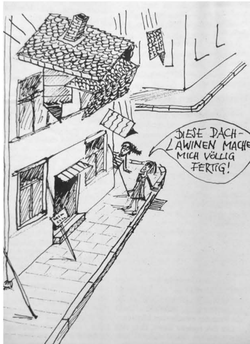
Achtung Dachlawine! – mal wörtlich genommen (Zeichnung von kat)

projekt wird der geplante Tunnelbau, aber das Porto für einen Brief ist nicht drin. Die junge Dame der Regierung von Oberbayern zeigt Verständnis für die missliche Lage. Jetzt noch einmal die ein oder andere Einwendung aufgreifen, konkretisieren, Fragen stellen. Aus dem Dunkel summt die Technik aus dem Dunkel kommen die Antworten von Herrn Scheller und Co. In gedämpftem Ton. Liegt es an dem unerträglichen Ort? Das Verfahren schläfert ein. Nach zehn Minuten: Keine weiteren Fragen mehr. Der Vertreter der Regierung von Oberbayern fragt, ob man die Einwendungen aufrechterhält. Ja – es scheint wie die einzige Form einer möglichen Gegenwehr, und zu-