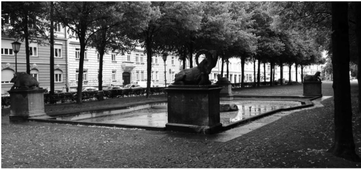
Diesmal also auf dem Bordeauxplatz – vielleicht läuft bis dahin der Brunnen!

Öffnungszeiten: Ateliers und Werkstätten: Fr. 4. + Sa 5. Juli, 13 – 20 Uhr So. 6. Juli, 13-18 Uhr