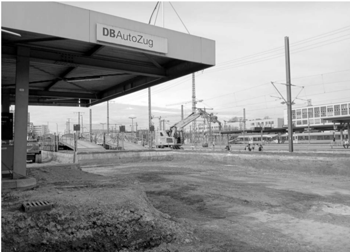
Schon lange vor dem offiziellen „Baubeginn“ des 3. Abschnitts der 2. Stammstrecke wurde die Autozugesanlage in großen Teilen abgetragen. Dies hat die Bahn mit der nötigen Baufreiheit für den neuen Tunnelbahnhof begründet.