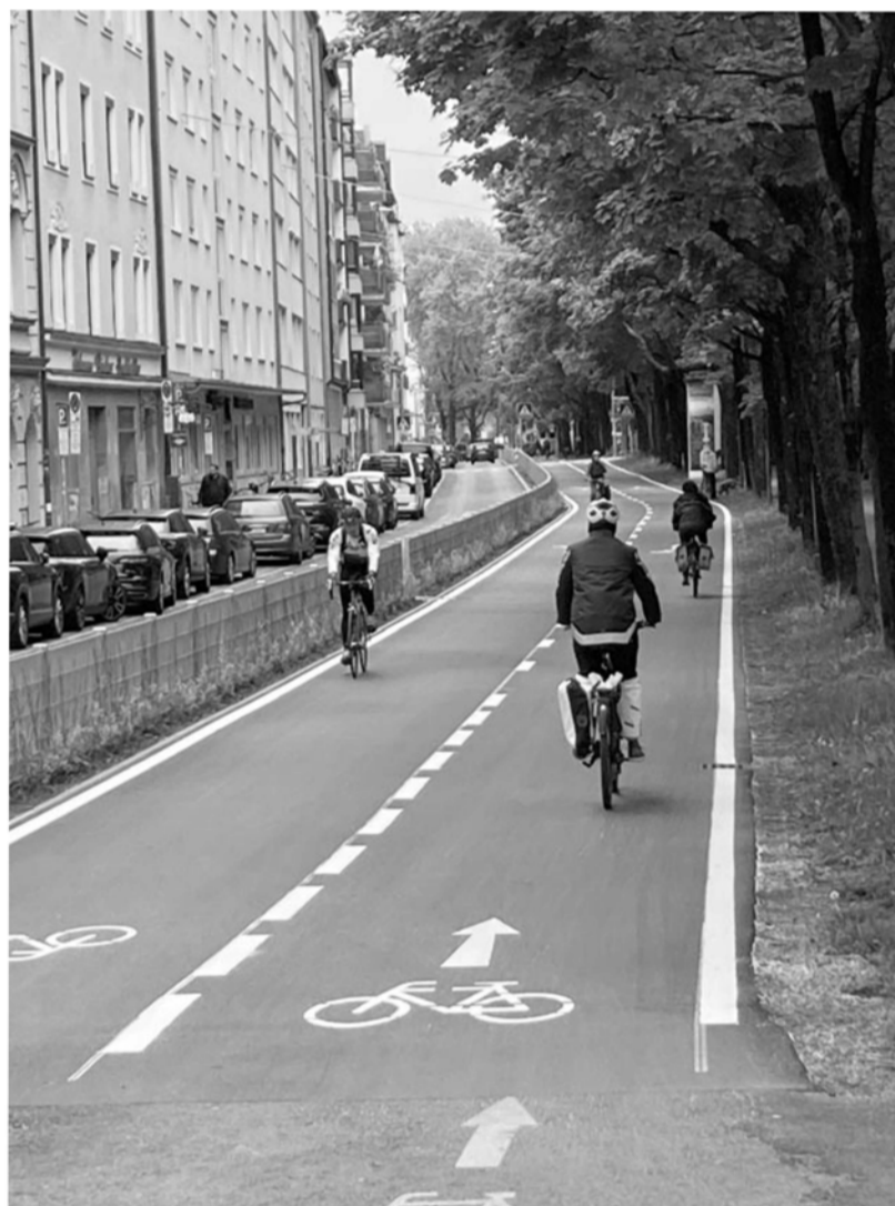
Ein vorbildlich gestalteter Radweg zwischen Ludwigsbrücke und Kreuzplätzchen, entlang der Zeppelinstraße, ist fertig. Wie auf diesem Foto sichtbar erhalten die Radfahrenden auf diesem Teilstück des Isarradweges großzügig Platz und dadurch erheblich mehr Sicherheit.