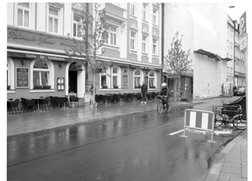
Gut Ding will Weile haben – Neupflanzungen Sedanstraße 1.