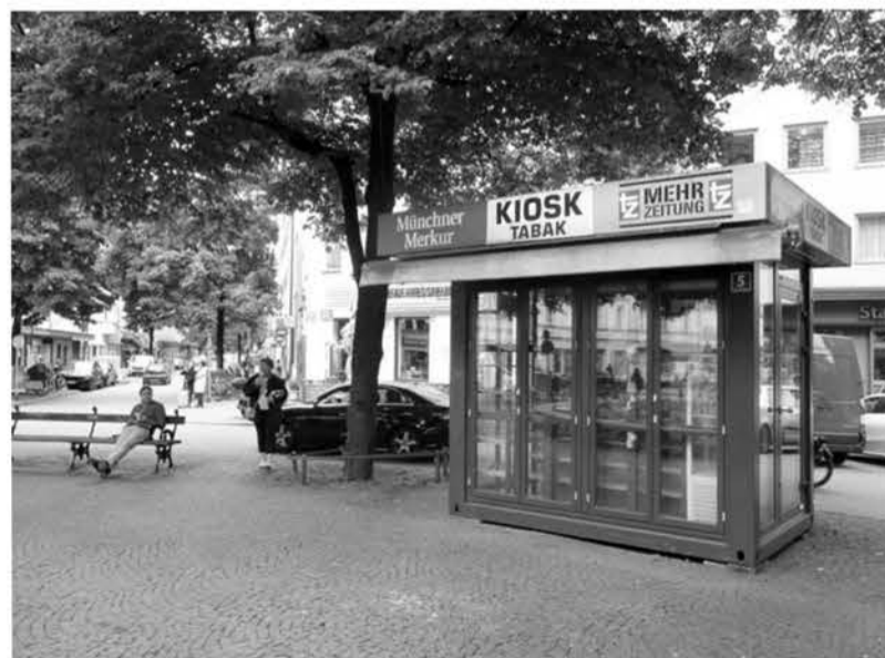
Dauerhafter Leerstand auf dem Pariser Platz – Nikolaus Haeusgen (CSU) erwog jüngst den Gedanken, den Kiosk unter Denkmalschutz zu stellen.