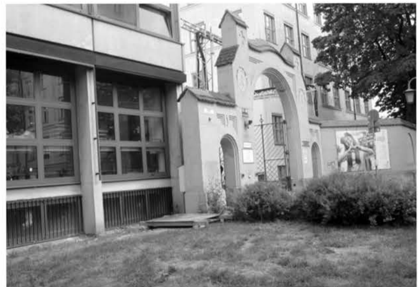
Fehlende Nachpflanzung am Eingang Stiftungshochschule Metz-/Preysingstraße.