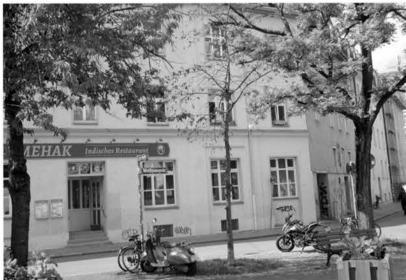
Kränkelnder Baum vor dem ASZ Wolfgangstraße.