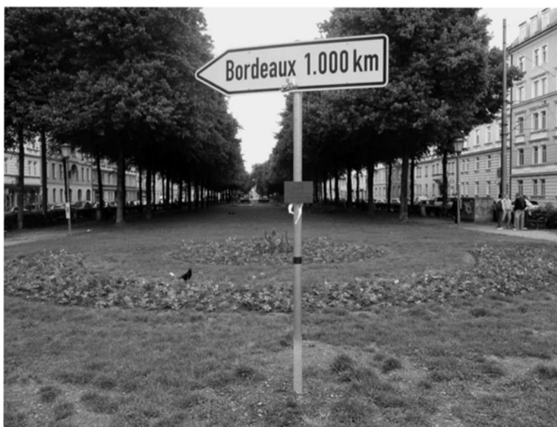
Ganze Arbeit! In den letzten Maitagen ist die Weinrebe, ein Geschenk aus Bordeaux, die Mitglieder der „Initiative München Bordeaux“ im vergangenen Jahr (2. Versuch!) gepflanzt haben, zerstört worden. Was mögen sich Gäste aus unserer Partnerstadt angesichts dieser Lieblosigkeit und des mangelnden Respekts dabei denken?! Chères amies, chers amis, on vous demande pardon!