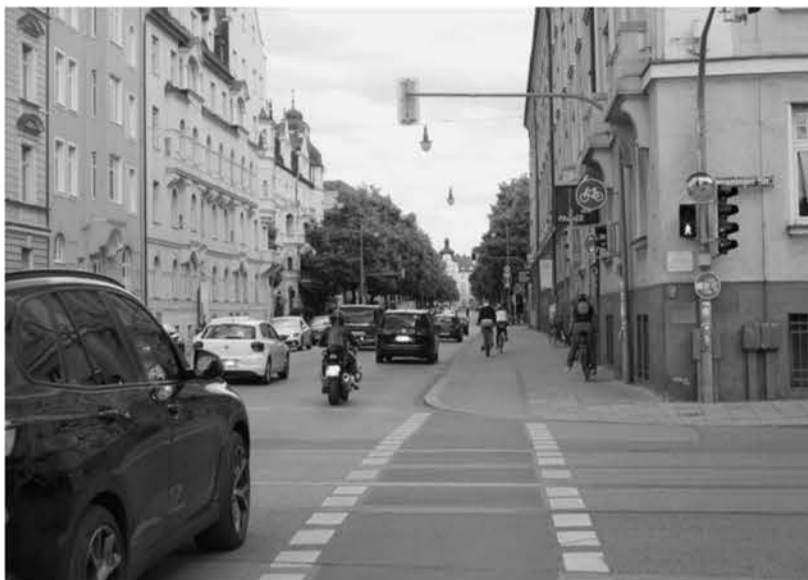
Prinzregentenstraße stadtauswärts zwischen Ismaninger Straße und Prinzregentenplatz: Der (nicht benutzungspflichtige) Radweg ist sehr eng und mit 50 Sachen ist der Autoverkehr unterwegs. Ein Haidhauser regte Tempo 30 für den Autoverkehr an. Der Bezirksausschuss will mit seinen Kolleginnen und Kollegen des BA Bogenhausen in Kontakt treten.

Poller sollen auf Antrag der Grünen-Fraktion auch an der Ecke Wörthstraße/Orleansplatz die Verkehrssituation verbessern. Sehr oft ist der dort abgesenkte Gehsteig zugesperrt. An dieser Stelle wollen aber viele Menschen die Straße überqueren, um zur Trambahnhaltestelle am Orleansplatz oder zum U-Bahn-Zugang zu gelangen. Dass der Parkdruck und das damit einhergehende illegale Parken am Orleansplatz ansteige, sieht Andreas Miksch (CSU) eher als Folge der neuen Fahrradständer auf Höhe des Oxfam-Ladens, denen einige Park-