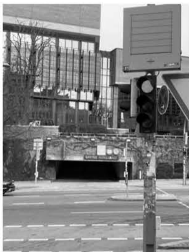
Zufahrt zur Gasteig-Tiefgarage von der Hochstraße aus gesehen.

Rücksicht zu nehmen. Die Ampel wäre also eigentlich nicht erforderlich. Verstärkt wird dieses Thema noch dadurch, dass im Gasteig kaum noch große Veranstaltungen mehr stattfinden und diese Tiefgarage also eher wenig genutzt. Es ergibt sich also eine Situation, die Fußgängerampel wird auf rot geschaltet und so gut wie nie passiert etwas. Also wird diese Ampel von fast allen Passanten auch bei rot nicht beachtet.