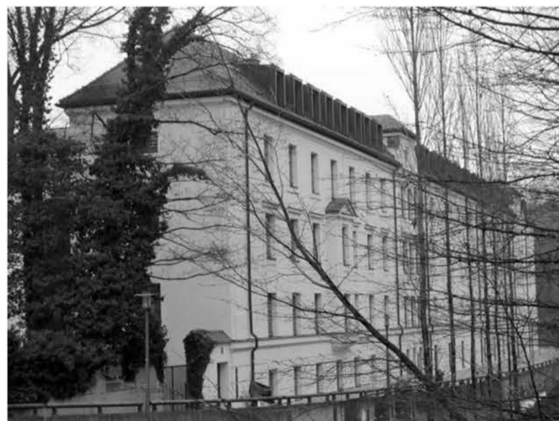
Die Eigentumswohnanlage im ehemaligen Gefängnis Am Neudeck wirkt unbelebt und trostlos.

Teil des Antrags ist eine Liste mit 30 Personen, die während der NS-