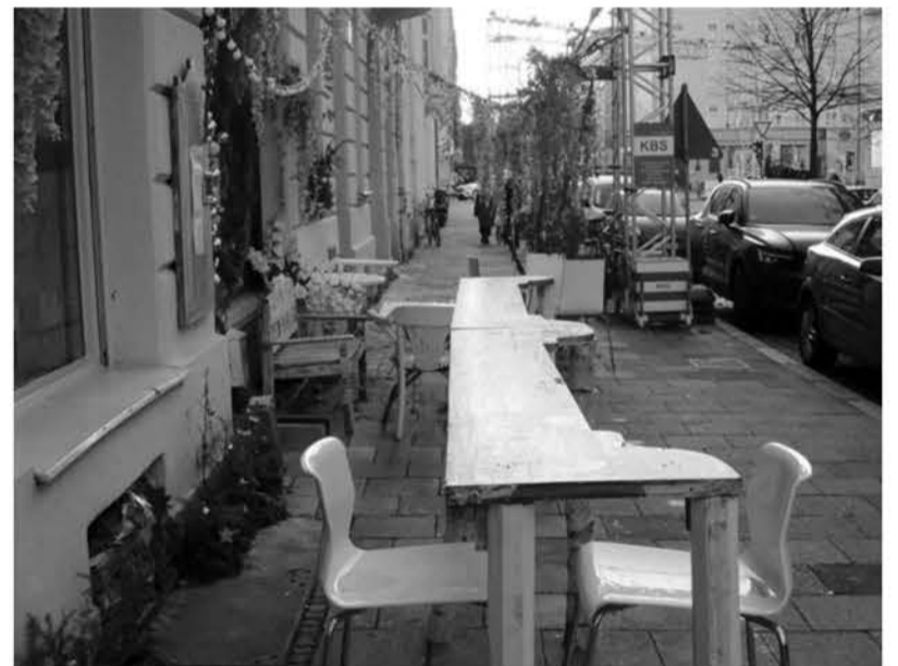
Winterliche Freischankfläche Breisacher Straße 4.