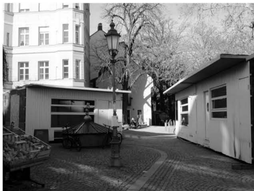
Markt auf dem Wiener Platz – Umzugscontainer für die Sanierung der Marktstandl.