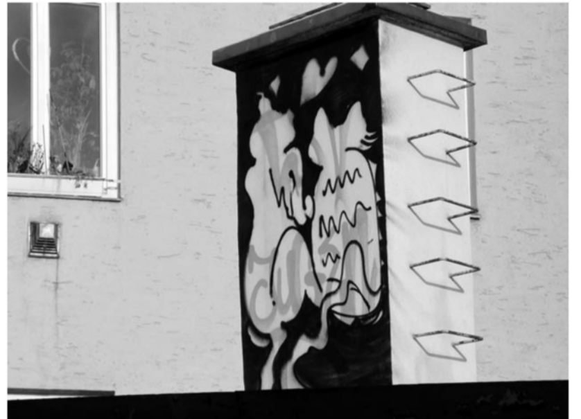
Suchbild: Wo sitzen die beiden Katzen beieinander?

Jeden Freitag von 17 bis 18 Uhr im FatCat, im ehemaligen Gasteig in der Rosenheimer Straße 5.