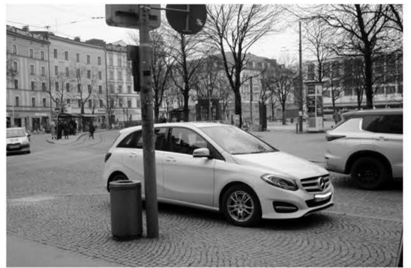
Wie am Orleansplatz fehlen an vielen Stellen im Viertel Poller, die das Befahren von und Parken auf Fußgängern vorbehaltenen Flächen verhindern. Das städtische Baureferat beklagt den großen Verlust intakter Poller und rüstet aus Kostengründen nicht nach. Nina Reitz (SPD) machte darauf aufmerksam, dass es „flexible“ Poller gibt, die sich nach einer Kollision wieder aufrichten (Anregung eines Bürgers).

Immerhin ist offenbar weiterhin beabsichtigt, im südwestlichen Bereich des Johannisplatzes bei der Einmündung der Schiltbergerstraße die Fläche zu entsiegeln, die bislang als Parkplatz genutzt wird. Das Planungsreferats teilte Anfang Dezember vergangenen Jahres mit, dass „die Entsiegelung der südwestlichen Ecke des Johannisplatzes/Bereich Schiltbergerstraße vertraglich“ als Teil der Kompensationsmaßnahme vereinbart ist. Vom Mobilitätsreferat war bis Drucklegung keine abschließende Auskunft zu erhalten, ob es seinen Einwand, damit verschlechterte sich unzumutbar das Parkplatzangebot, zurückgezogen hat.