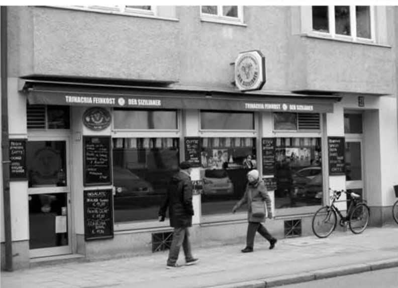
Hier gibt's „Libera Terra“-Produkte zu genießen.