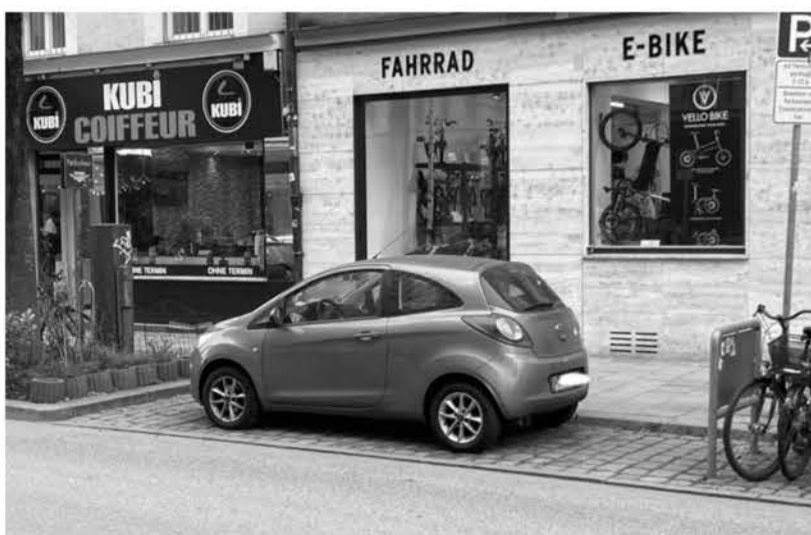
Weißenburger Straße 44, Hier soll ein Parklet entstehen.

Eine verzwickte Situation. Eigentlich ist klar, wenn Fahrzeuge einen Gehweg überqueren, hat der Fußgänger Vorrang. Der Fahrer ist verpflichtet, den Passanten den Vorrang einzuräumen und entsprechend