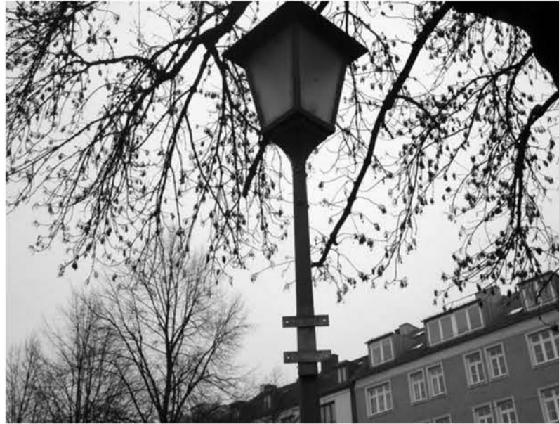
Am Bordeauxplatz fehlt seit langem die Tafel, die auf die bestehende Städtepartnerschaft München-Bordeaux hinweist.

In diesem Zusammenhang sei auf die Kooperativen „Libera Terra“ in Italien hingewiesen. Sie wurden sukzessive ab der Mitte der 1990er Jahre zunächst auf Sizilien, dann auch in Kalabrien, Apulien und Kampanien gegründet, fußend auf zwei vom italienischen Parlament beschlossenen Gesetzen, wonach Vermögen, Immobilien und Land von überführten Mafiosi eingezogen und an landwirtschaftliche und soziale Kooperativen zur ökologischen Bewirtschaftung mit guten sozialen Arbeitsbedingungen vergeben werden kann. „In diesem Klima gründete der italienische Priester Don Luigi Ciotti die politische Organisation Libera. Der Geistliche wollte jungen und arbeitslosen Menschen in Süd-